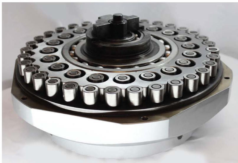
Рисунок 3 — Двухступенчатый планетарно-цевочный редуктор электропривода РэмТЭК с максимальным моментом 4000 Нм.

Вторая особенность — наличие единственного цевочного колеса, на котором отверстия под параллельный кривошип