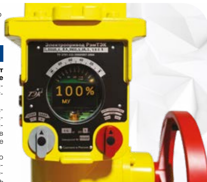
Рис. 4. Внешний вид поста местного управления электропривода РэмТЭК «91»

Для оценки текущего и прогнозирования будущего состояния энергоаккумулятора РэмТЭК производится постоянный мониторинг основных параметров: электрическая емкость SOC, внутреннее сопротивление, уровень SOH. Для электронных модулей накопителя реализован тест основных электронных узлов с применением встроенного диагностического программного обеспечения. На основании измеренных данных реализован предиктивный анализ основных параметров энергоаккумулятора с учетом количества циклов заряда – разряда, температуры и токов разряда. Эти меры позволяют получить полную информацию о состоянии аккумулятора электрической энергии и служат основой для принятия своевременных мер по обеспечению надежности.