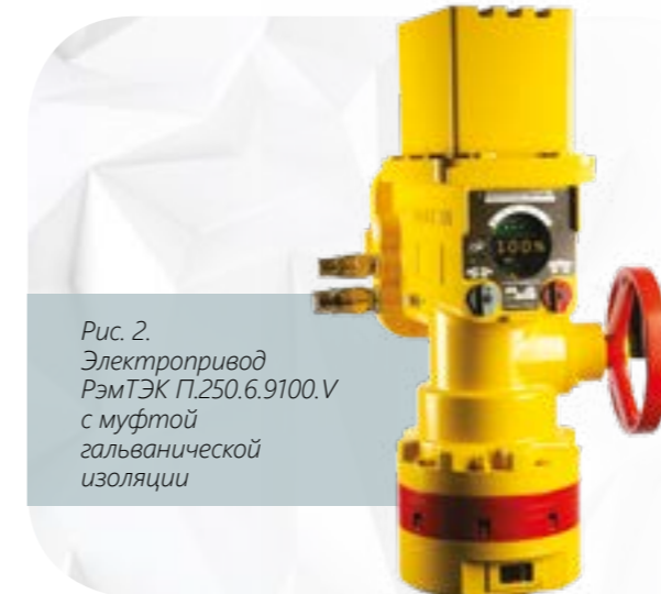
Рис. 2. Электропривод РэмТЭК П.250.6.9100.V с муфтой гальванической изоляции

Использование современных технических решений в электроприводе РэмТЭК позволяет реализовать режим штатного управления арматурой на малой скорости с обеспечением высокой точности позиционирования и поддержания технологического параметра.