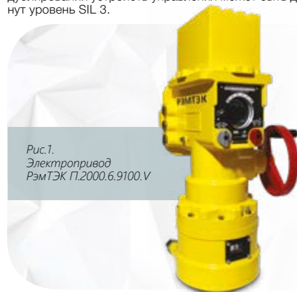
Рис.1. Электропривод РэмТЭК П.2000.6.9100.V

Электропривод РэмТЭК «91» с функцией безопасного состояния, НО/НЗ разработан R&D центром ООО НП «ТЭК» специально для применения в системах безопасности, в системах пожаротушения и противоаварийной защиты (ПАЗ), имеет высокие сертифицированные показатели отказоустойчивости, соответствующие уровню полноты безопасности SIL 2. При дублировании устройств управления может быть достигнут уровень SIL 3.