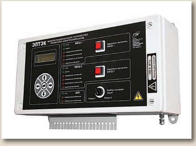
Рис. 2 Внешний вид ЭЛТЭК

• необходимо обеспечить возможность выбора и установления основного (остальные два ввода будут резервными) ввода электропитания;